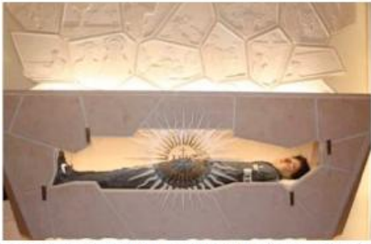
Tombeau de Carlo Acutis