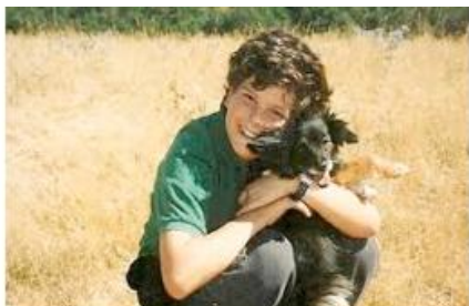
Carlo Acutis et l'un de ses chiens

Les nombreuses amitiés, masculines comme féminines, de